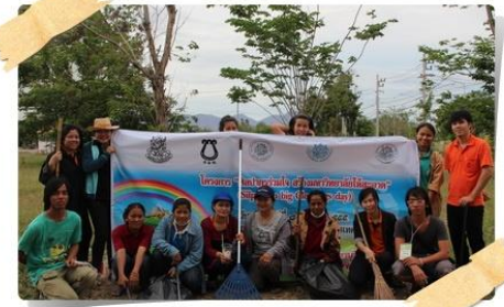
หอพักนักศึกษา 1 และที่พักรับบุคลากร