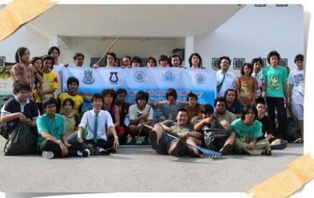
อาคารปฏิบัติการยานพาหนะ