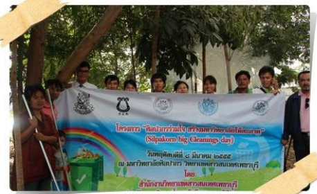
อาคารสัตวศาสตร์และศิลปะ เพชรภริมย์