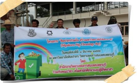
โรงผลิตน้ำ