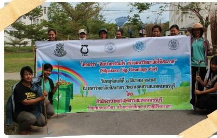
หอพักนักศึกษา 2-6