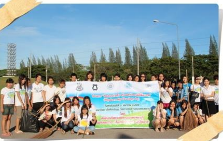
หน้ามหาวิทยาลัย/สวนประติมากรรม และอาคาร OTOP