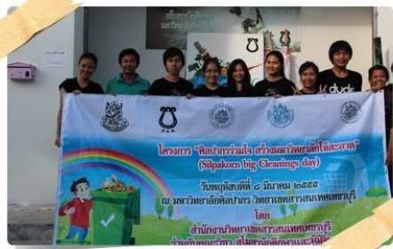
โรงพลศึกษา